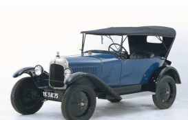
CITROËN C3 5HP (1922-1926) Les Dossiers documentaires du Conservatoire CITROËN

Une collection thématique qui s'enrichit